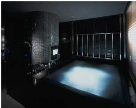
BlueHotel OCTA A701号室

ブルホの泉…ですね!「へえ」と思っ方もいらつしやるかもしれませんが、私が私たちスタッフにとっても「80へえ」を超えた、予想もなかった嬉しい現象なのです。ブルホ最大のテーマは、満ち足りた二人だけの時間。二人だけの幸せな空間作り。ですから「ブルホの泉」に願いを込める…というお客様