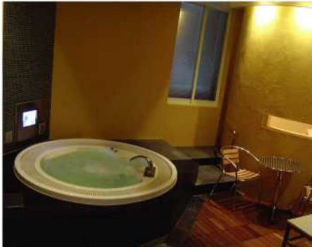
BlueHotel OCTA C207号室