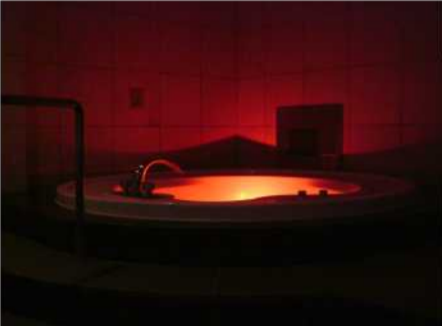
BlueHotel OCTA A205号室

ラルウォーターは、ブルーホテルグループの全室に無料で用意されており、ひんやり美味しいばかりか、現代人に不足しがちなカルシウムとマグネシウムまた、八十四種類のミネラルを一度に摂取することが出来ます。